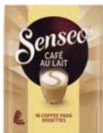
DOSETTES CAFÉ AU LAIT SENSEO x16 - soit 168 g