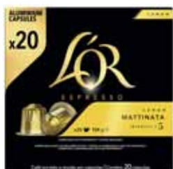
CAPSULES DE CAFÉ X 20 LUNGO MATTINATA L'OR 104 g