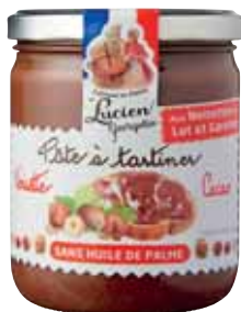
PÂTE À TARTINER NOISETTE CACAO LUCIEN GEORGIN 400 g