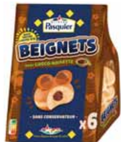
BEIGNETS GOÛT CHOCOLAT NOISETTE PASQUIER x6 - soit 270 g