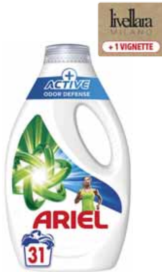
LESSIVE LIQUIDE ACTIVE ODOR DEFENSE 31 LAVAGES ARIEL (b) 1,395 l