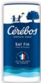
SEL FIN IODÉ FLUORÉ CEREBOS 500 g