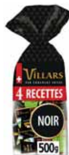
ASSORTIMENT DE MINI CHOCOLATS 4 RECETTES CHOCOLAT NOIR VILLARS 500 g

POUR VOTRE SANTÉ, ÉVITEZ DE MANGER TROP GRAS, TROP SUCRÉ, TROP SALÉ. WWW.MANGERBOUGER.FR