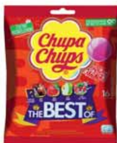
SUCETTES THE BEST OF CHUPA CHUPS 192 g