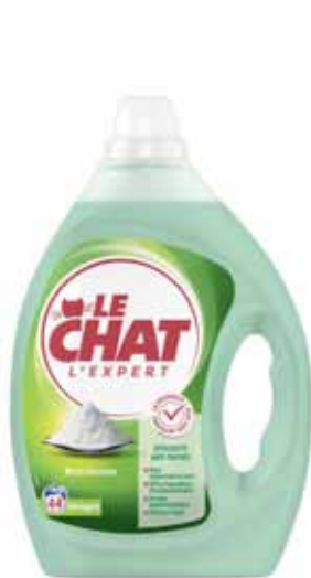
LESSIVE LIQUIDE L'EXPERT BICARBONATE X 44 LAVAGES LE CHAT (b) 1,98 l