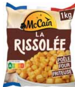
LA RISSOLÉE SURGELÉE MC CAIN 1 kg