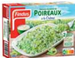
POIREAUX À LA CRÈME FINDUS 450 g