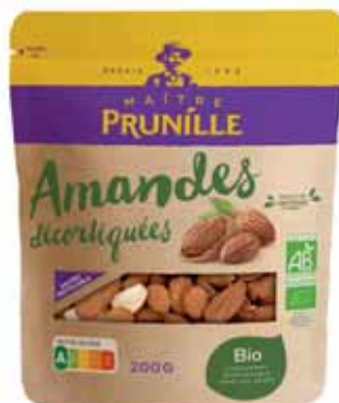
AMANDES DÉCORTIQUÉES BIO MAÎTRE PRUNILLE 200 g