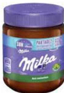
PÂTE À TARTINER AUX NOISETTES ET AU CACAO MILKA 340 g

POUR VOTRE SANTÉ, MANGEZ AU MOINS CINQ FRUITS ET LÉGUMES PAR JOUR. WWW.MANGERBOUGER.FR (Suggestions de présentation)