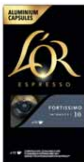
CAPSULES DE CAFÉ X 10 FORTISSIMO N°10 L'OR 52 g