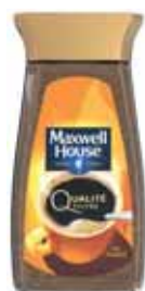
CAFÉ SOLUBLE QUALITÉ FILTRE MAXWELL HOUSE 200 g