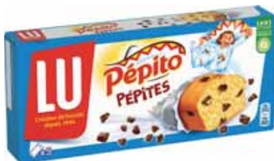
PÉPITO CHOCO PÉPITES LU 150 g