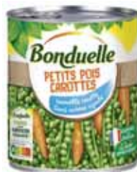
PETITS POIS CAROTTES BONDUELLE 530 g