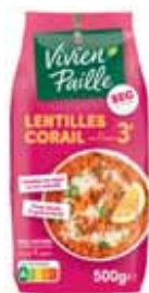
LENTILLES CORAIL CUISSON RAPIDE 3MIN VIVIEN PAILLE 500 g