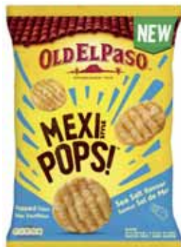
CHIPS SOUFLÉES SAVEUR SEL DE MER OLD EL PASO 85 g