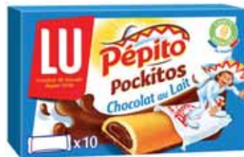
PEPITO POCKITOS LAIT LU 295 g

POUR VOTRE SANTÉ, ÉVITEZ DE MANGER TROP GRAS, TROP SUCRÉ, TROP SALÉ. WWW.MANGERBOUGER.FR