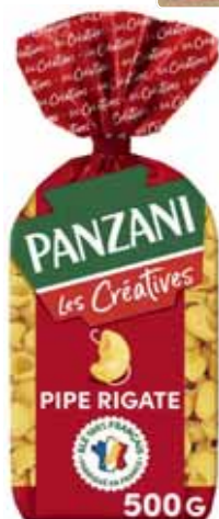
PÂTES PIPE RIGATE PANZANI 500 g