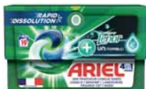
LESSIVE PODS+ 4 EN 1 TOUCH OF LENOR UNSTOPPABLES X 19 ARIEL (b) 408 g