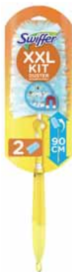
KIT PLUMEAUX XXL + 2 RECHARGES SWIFFER