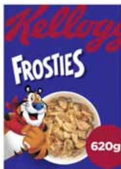
CÉRÉALES FROSTIES KELLOGG'S 620 g