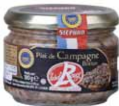
PÂTÉ DE CAMPAGNE IGP BRETON LABEL ROUGE STEPHAN 180 g