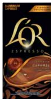
CAPSULES DE CAFÉ X 10 CAMEL L'OR 52 g