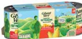
MAÏS EXTRA CROQUANT GÉANT VERT 3x140g - soit 420 g