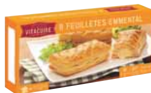
FEUILLETÉS EMMENTAL X8 SURGELÉS VITACUVE 520 g