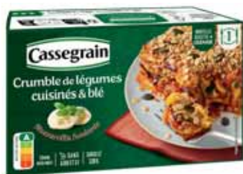
CRUMBLE DE LÉGUMES CUISINÉS ET BLÉ CASSEGRAIN 330 g