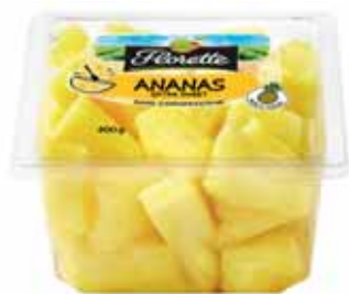
ANANAS MORCEAUX FLORETTE 400 g