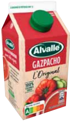
GAZPACHO L'ORIGINAL ALVALLE 500 ml