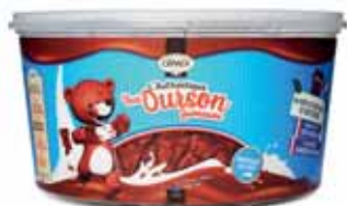
TUBO OURSONS GUIMAUVES CÉMOI 421 g