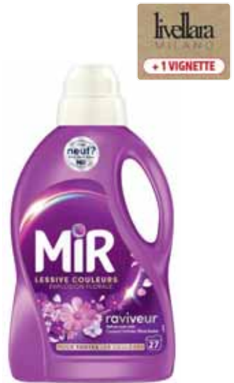
LESSIVE COULEURS EXPLOSION FLORALE X27 LAVAGES RAVIVEUR MIR (b) 1,35 l