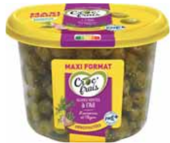
OLIVES VERTES DÉNOYAUTÉES À L'AIL CROC FRAIS 500 g