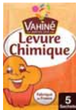
LEVURE CHIMIQUE VAHINÉ 55 g