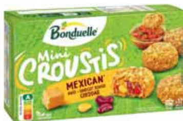
MINI CROUSTIS MEXICAN X12 SURGELÉS BONDUELLE 240 g