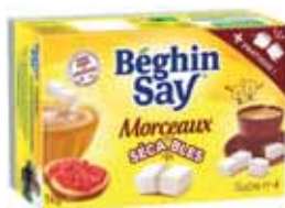
SUCRE EN MORCEAUX SÉCABLES BÉGHIN SAY 1 kg