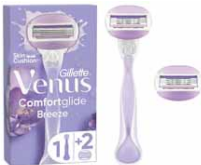
RASOIR COMFORTGLIDE BREEZE + 2 RECHARGES VENUS