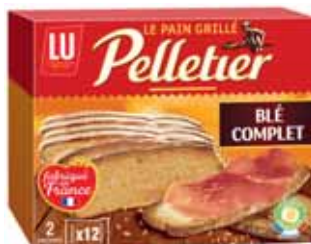
PAIN GRILLÉ PELLETIER COMPLET LU 2 x 12 tranches - soit 500 g