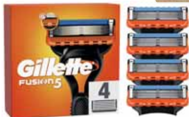
LAMES FUSION X4 GILLETTE