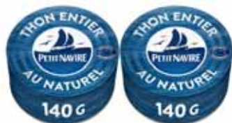
THON NATUREL DÉMARCHE RESPONSABLE PETIT NAVIRE 2x140g - soit 280 g