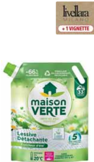
LESSIVE DÉTACHANTE FRAICHEUR D'ÉTÉ MAISON VERTE (b) 1,485 l