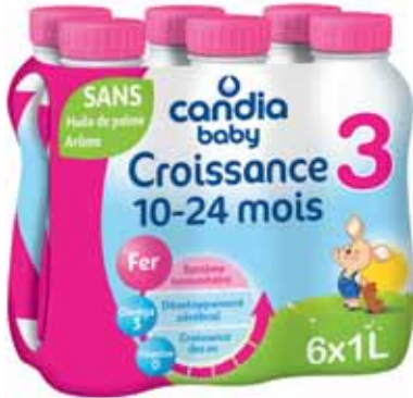
BABY CROISSANCE 3IÈME ÂGE DÈS 10 MOIS CANDIA 6X1L - soit 6 l