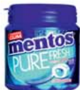
GUM EUCALYPTUS MENTOS GUM 110 g