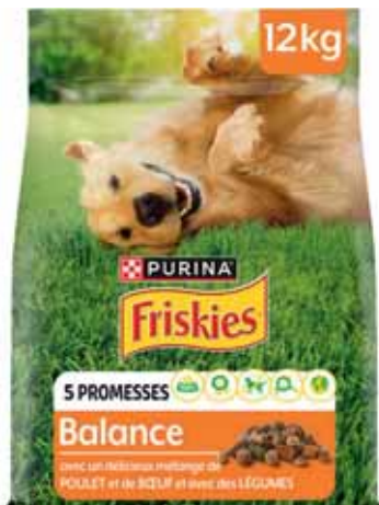
CROQUETTES POUR CHIEN POULET ET BŒUF FRISKIES 12 kg