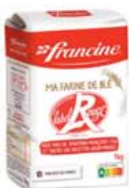
FARINE DE BLÉ LABEL ROUGE FRANCINE 1 kg