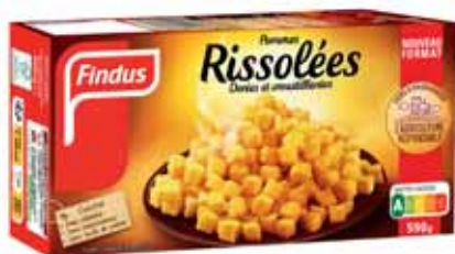
POMMES RISSOLÉES SURGELÉES FINDUS 590 g