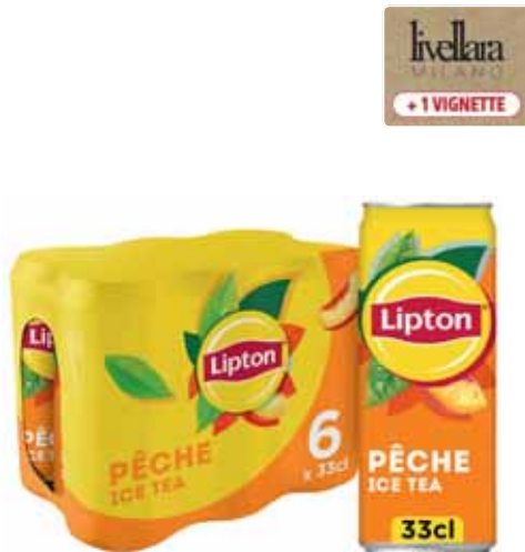
BOISSON AU THÉ PÊCHE LIPTON 6x33cl - soit 1,98 l