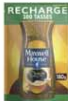
CAFÉ SOLUBLE ECO RECHARGE MAXWELL HOUSE 180 g