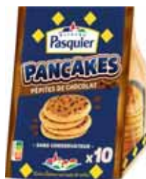
PANCAKES PÉPITES DE CHOCOLAT BRICHOE PASQUIER x10 - soit 350 g