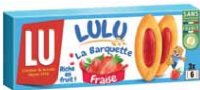
LULU LA BARQUETTE FRAISE LU 120 g