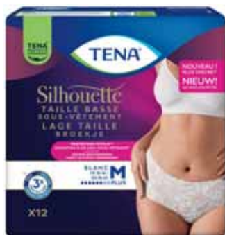
SOUS-VÊTEMENT BLANC TAILLE BASSE M X12 TENA