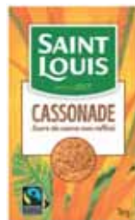
ÉTUI BEC VERSEUR CASSONADE SAINT LOUIS 1 kg