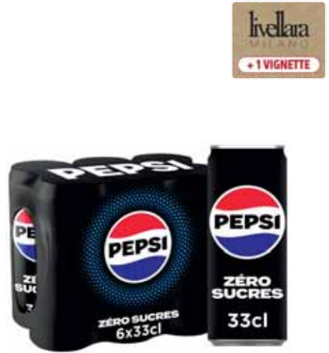
BOISSON GAZEUSE ZÉRO SUCRES PEPSI 6x33cl - soit 1,98 l