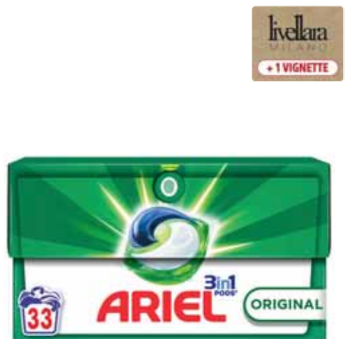
LESSIVE PODS 33D ORIGINAL 3 EN 1 ARIEL (b) 676 g