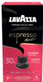
CAPSULES X 30 MAESTRO CLASSICO LAVAZZA 171 g