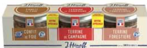
TERRINES FORESTIÈRE, CAMPAGNE ET CONFIT DE FOIE HÉNAFF 3x180g - soit 540 g

POUR VOTRE SANTÉ, PRATIQUEZ UNE ACTIVITÉ PHYSIQUE RÉGULIÈRE. WWW.MANGERBOUGER.FR