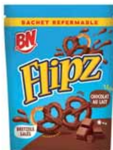
BISCUIT BRETZEL FLIPZ CHOCOLAT AU LAIT BN 90 g

POUR VOTRE SANTÉ, ÉVITEZ DE MANGER TROP GRAS, TROP SUCRÉ, TROP SALÉ. WWW.MANGERBOUGER.FR