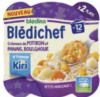
BLÉDICHEF CRÉMEUX DE POTIRON ET PANAIS, BOULGHOUR ET FROMAGE KIRI ® BLÉDINA 2X230g - soit 460 g

APPRENEZ À VOTRE ENFANT À NE PAS GRIGNOTER ENTRE LES REPAS. WWW.MANGERBOUGER.FR BOUGER, JOUER EST INDISPENSABLE AU DÉVELOPPEMENT DE VOTRE ENFANT. WWW.MANGERBOUGER.FR EN PLUS DU LAIT, L'EAU EST LA SEULE BOISSON INDISPENSABLE. WWW.MANGERBOUGER.FR POUR VOTRE SANTÉ, PRATIQUEZ UNE ACTIVITÉ PHYSIQUE RÉGULIÈRE. WWW.MANGERBOUGER.FR (Suggestions de présentation)