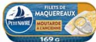
FILETS DE MAQUEREUX À LA MOUTARDE SANS ARÔME PETIT NAVIRE 169 g