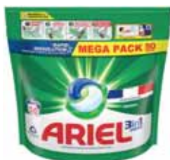
LESSIVE PODS 3 EN 1 ORIGINAL X 50 ARIEL (b)