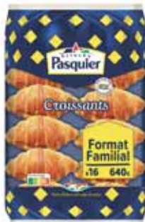
CROISSANTS PASQUIER x16 - soit 640 g