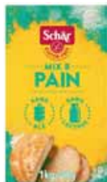
FARINE A PAIN SCHAR 1,02 kg