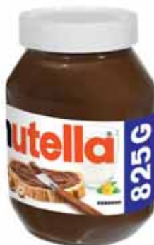
PÂTE À TARTINER NOISETTES ET CACAO NUTELLA 825 g