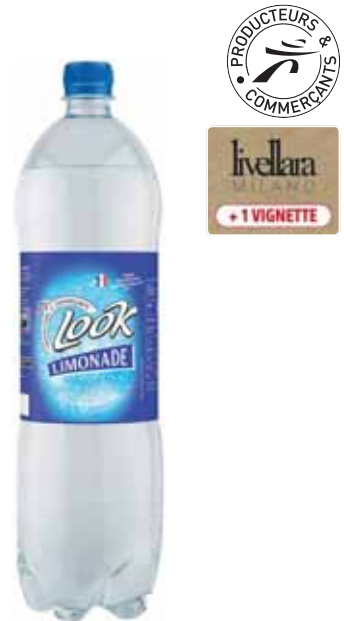
LIMONADE LOOK 1,5 l

POUR VOTRE SANTÉ, ÉVITEZ DE MANGER TROP GRAS, TROP SUCRÉ, TROP SALÉ. WWW.MANGERBOUGER.FR