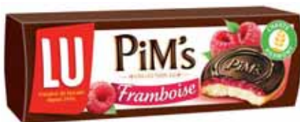
BISCUITS FOURRÉS PIM'S FRAMBOISE LU 150 g