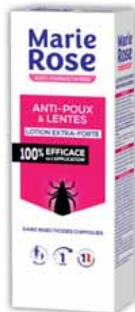
LOTION ANTI-POUX ET LENTES EXTRA FORTE MARIE ROSE 100 ml