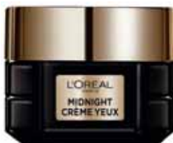
CRÈME YEUX MIDNIGHT L'OREAL 15 ml