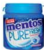
CHEWING-GUM FRESHMINT MENTOS 110 g