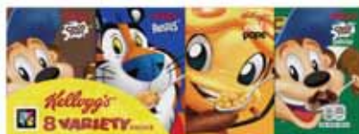
CÉRÉALES VARIETY COCO POPS CHOCOS, COCO POPS, FROSTIES KELLOGG'S 220 g