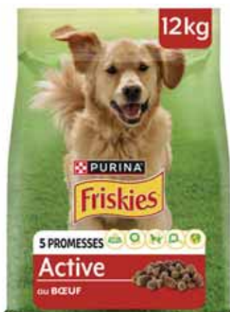
CROQUETTES CHIEN BŒUF FRISKIES 12 kg