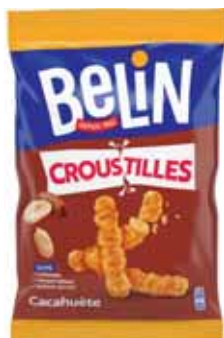
CROUSTILLES CACAHUÈTE BELIN 138 g