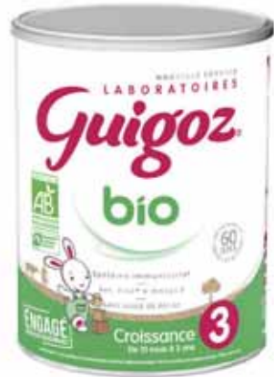
LAIT DE CROISSANCE BIO 3 OPTIPRO GUIGOZ 800 g