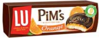
BISCUITS FOURRÉS PIM'S ORANGE LU 150 g