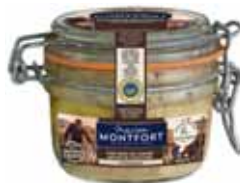
FOIE GRAS DE CANARD ENTIER DU SUD OUEST MAISON MONTFORT 130 g