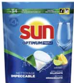
CAPSULES LAVE VAISSELLE OPTIMUM NETTOYAGE IMPECCABLE AGRUMES X34