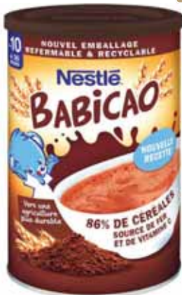
BABICAO POUDE CACAO NESTLÉ 400 g