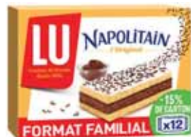
NAPOLITAIN CLASSIQUE LU 360 g