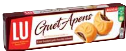
GUET-APENS LU 105 g