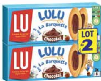
LULU LA BARQUETTE CHOCOLAT NOISETTES 2 x 120g - soit 240 g