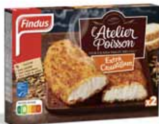
L'ATELIER POISSON COLIN D'ALASKA CROUSTILLANT MSC SURGELÉ X2 FINDUS ® 250 g