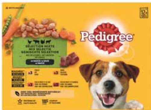
SACHETS FRAÎCHEUR CHIEN SÉLECTION MIXTE EN SAUCE PEDIGREE 12x100g - soit 1,2 kg