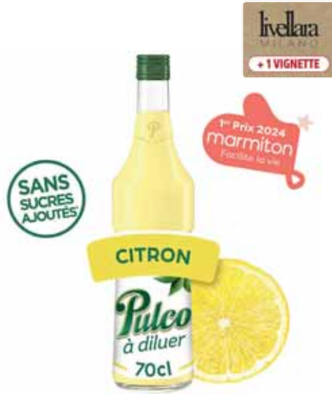
BOISSON CONCENTRÉE CITRON PULCO 70 cl