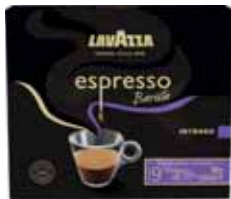
CAFÉ MOULU ESPRESSO BARISTA INTENSITÉ 9 LAVAZZA 2 x 250 g - soit 500 g