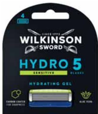
LAMES HYDRO 5 SENSITIVE X4 WILKINSON