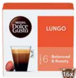
CAPSULES DE CAFÉ LUNGO NESCAFÉ DOLCE GUSTO 89,6 g