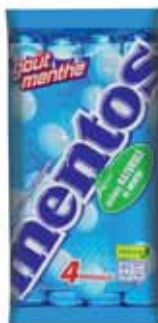
BONBONS TENDRES MENTHE MENTOS PCP 152 g