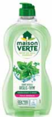
LIQUIDE VAISSELLE BASILIC-THYM MAISON VERTE (b) 500 ml