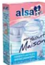
YAOURT MAISON ALSA 4 sachets - soit 8 g