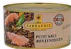
PETIT SALÉ AUX LENTILLES JEAN LARNAUDIE 1,24 kg