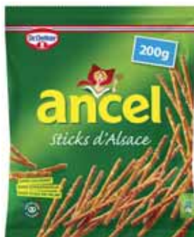
STICKS D'ALSACE ANCEL 200 g