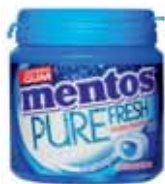
CHEWING-GUM FRESHMINT MENTOS 110 g