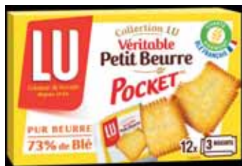
BISCUIT VÉRITABLE PETIT BEURRE POCKET LU 300 g