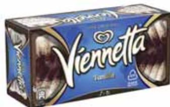
DESSERT GLACÉ VANILLE VIENNETTA 320 g