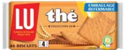
BISCUITS THÉ LU 350 g