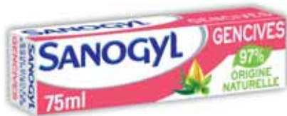
DENTIFRICE SOIN ESSENTIEL GENCIVES SANOGYL 75 ml