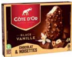
BÂTONNET DE GLACE À LA VANILLE ENROBÉ DE CHOCOLAT ET NOISSETTES X4 CÔTE D'OR 260 g