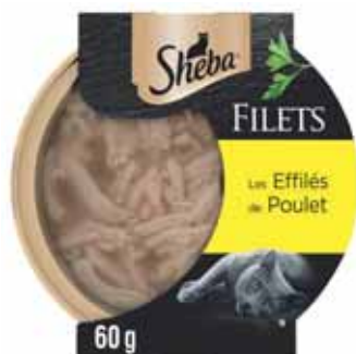
FILETS LES EFFILÉS DE POULET SHEBA 60 g