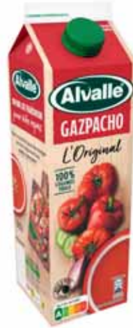
GAZPACHO L'ORIGINAL ALVALLE 1 l