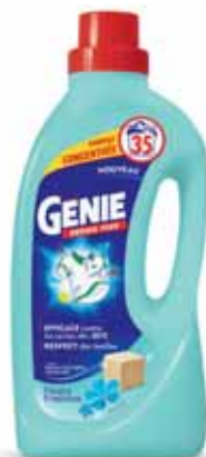
LESSIVE LIQUIDE FLEURS FRAÎCHES X35 LAVAGES GENIE (b) 1,4 l