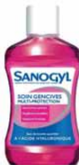
BAIN DE BOUCHE SOIN GENCIVES MULTI-PROTECTION À L'ACIDE HYALURONIQUE SANOGYL 500 ml