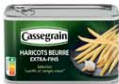
HARICOTS BEURRE CASSEGRAIN 220 g