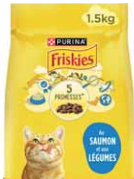
CROQUETTES POUR CHAT SAUMON FRISKIES 1,5 kg