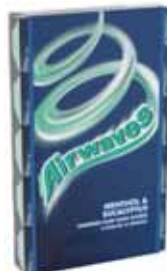
CHEWING-GUM MENTHOL & EUCALYPTUS AIRWAVES 70 g