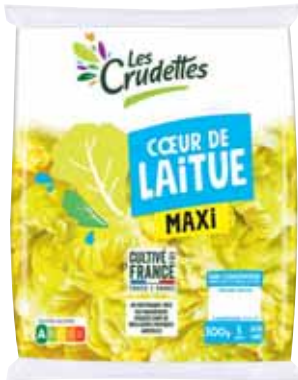
CŒUR DE LAITUE 100% FRANCE LES CRUDETTES 300 g