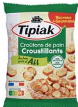
CROUTONS DE PAIN CROUSTILLANTS AIL TIPIAK 220 g

POUR VOTRE SANTÉ, MANGEZ AU MOINS CINQ FRUITS ET LÉGUMES PAR JOUR. WWW.MANGERBOUGER.FR (Suggestions de présentation)