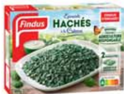
ÉPINARDS HACHÉS À LA CRÈME FRAICHE SURGELÉS FINDUS 500 g