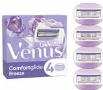
LAMES COMFORTGLIDE BREEZE X4 VENUS