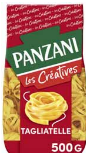
PÂTES TAGLIATELLE PANZANI 500 g