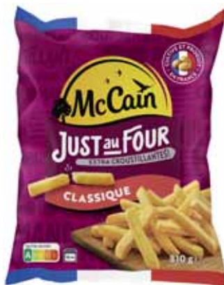
JUST AU FOUR CLASSIQUE SURGELÉ MCCAIN 810 g

POUR VOTRE SANTÉ, MANGEZ AU MOINS CINQ FRUITS ET LÉGUMES PAR JOUR. WWW.MANGERBOUGER.FR (Suggestions de présentation)