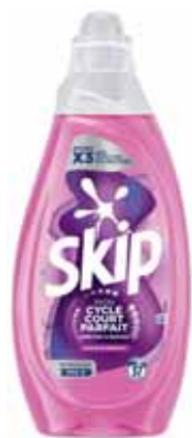
LESSIVE LIQUIDE MON CYCLE COURT COULEUR SKIP (b) 1,48 l