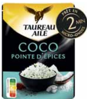
RIZ MICO-ONDES BASMATI COCO TAUREAU AILE 220 g