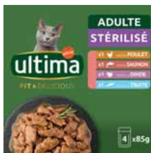
SACHET REPAS CHAT STÉRILISÉ VOLAILLES & POISSONS ULTIMA 4x85 g - soit 340 g

POUR VOTRE SANTÉ, ÉVITEZ DE GRIGNOTER ENTRE LES REPAS.