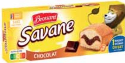
SAVANE POCKET CHOCOLAT BROSSARD 210 g