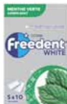
CHEWING-GUM WHITE MENTHE VERTE FREEDENT 70 g