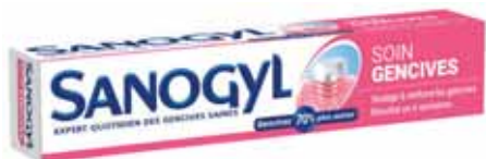
DENTIFRICE SOIN GENCIVE SANOGYL 75 ml