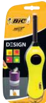
BRIQUET MULTI-USAGES MEGALIGHTER BIC Coloris Unique Dim. : 22 x 24,5 x 12 cm